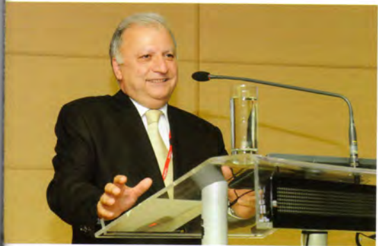
Politzer 2011 Atina - Açılış konferansı