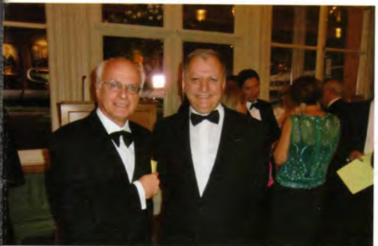
Politzer 2009 Londra - Eski ve Yeni Başkan