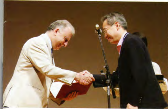
Kolesteatoma 2012 Nağasaki Konuşmacı sertifikası alınırken

Politzer yönetiminde 2 dönem çalışmakla görev tamamlanmış oluyor. Benim de görevimin tamamlandığını düşündüğüm son toplantıydı 2005 Seul... Yönetim Kurulu toplantısı sırasında, Mirko Tos artık